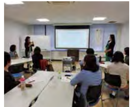
『パブリックスピーキング』(3月4日)

次に行われた、会議や研究ミーティング等のスムーズな進行やコミュニケーションにおける自己表現の方法を学ぶ『ファシリテーション』では、ファシリテーターとはどのような役割を担っているのか、会議等の場をどのようにまとめ、進めていくのかを学びました。ファシリテーターは、会の参加者が考えることやコミュニケーションすることを助ける役割を担っており、スムーズに進行させるためには共通のルールやゴールを予め設定し、参加者に伝えることが重要であると説明がありました。また、会の趣旨や参加者、会場を事前に把握するなどの事前準備の必要性や、参加者同士がコミュニケーションを取りやすくするための方法なども紹介されました。実習では、時間の制約がある中で講師がどのように会を進行していくかを参加者として体験し、その手法を学びました。