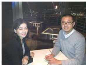
2012年11月大学近くのレストランにて夫と:

(年に一度あるかないかですが)家事育児を共にするパートナーとのコミュニケーションは大切