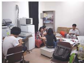
学生とのミーティング:

2007年4月 琉球大学 工学部 環境建設工学科 環境計画学講座 助教 現在に至る